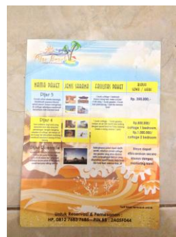
Gambar 2.6 Brosur