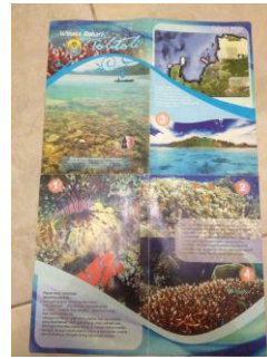
Gambar 2.4 Pamflet