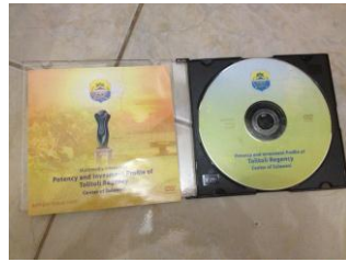
Gambar 2.3 Cd Interaktif