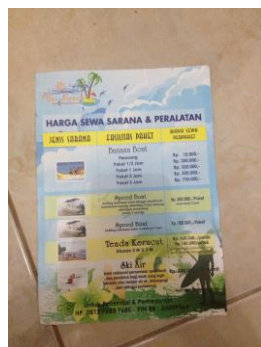
Gambar 2.5 Brosur