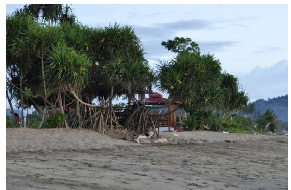
Gambar 2.2Pantai Pijar