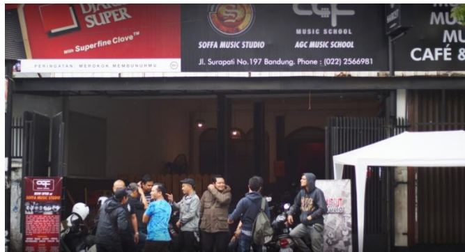
Gambar 4.4. Suasana tampak depan sekolah musik