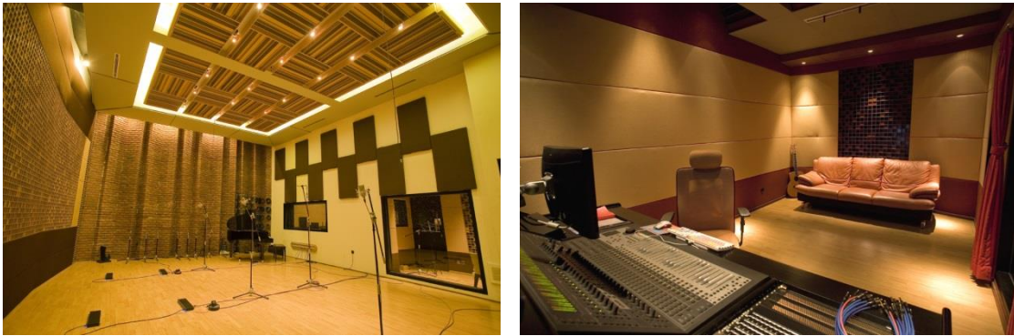
Gambar 4.3. Suasana studio rekaman dan studio musik artSound