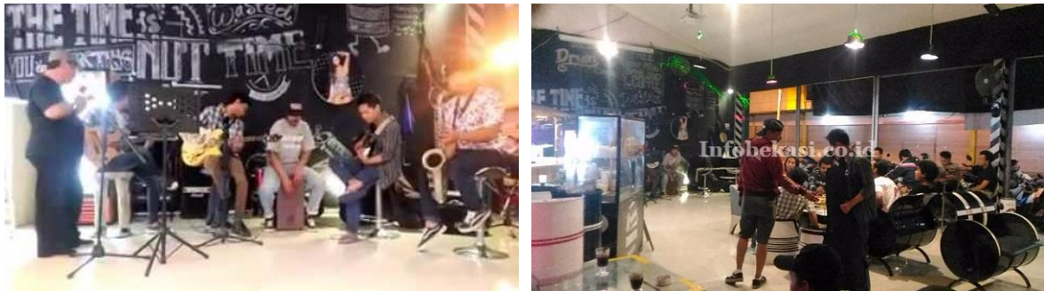
Gambar 4.5. Suasana drum cafe