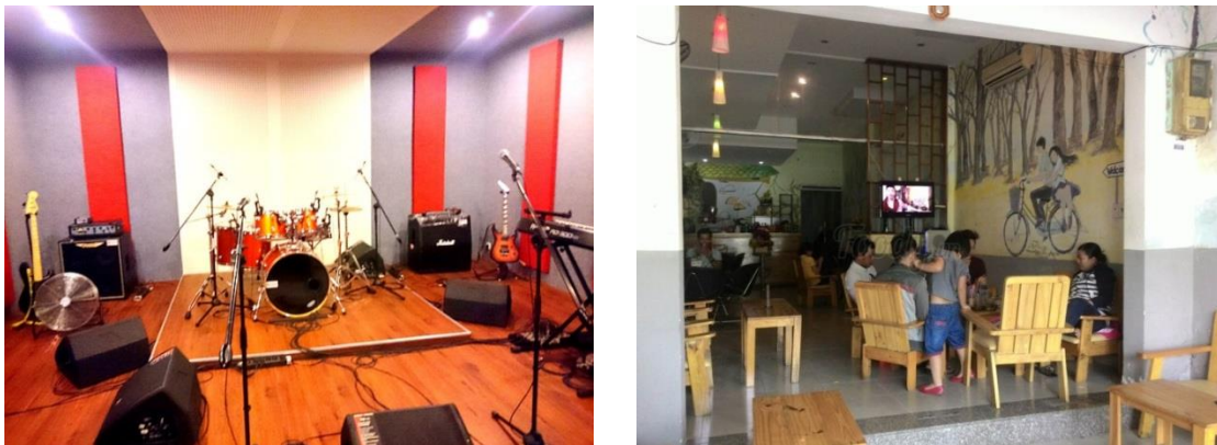
Gambar 4.2. Suasana studio rekaman max dan max cafe