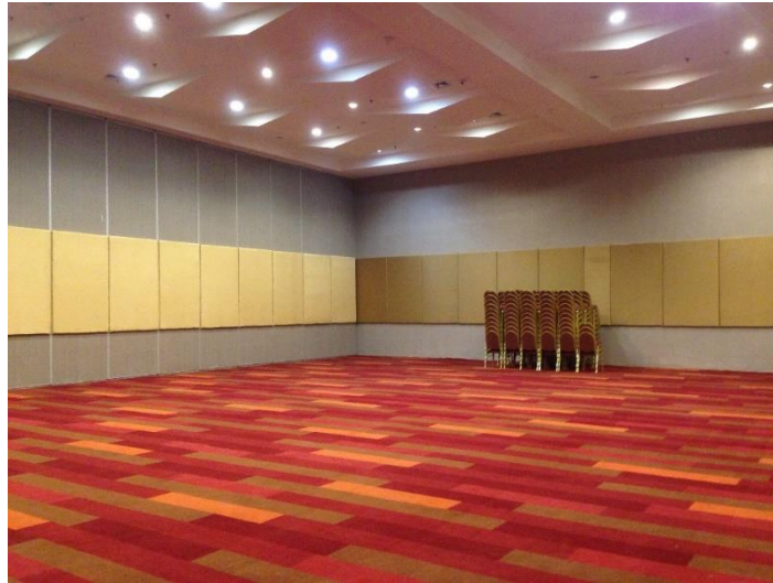
Gambar 3.4. Interior convention hall