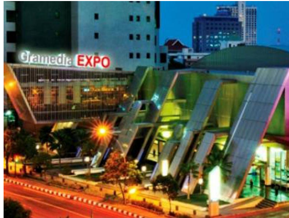
Gambar 3.2. Eksterior Dyandra convention center