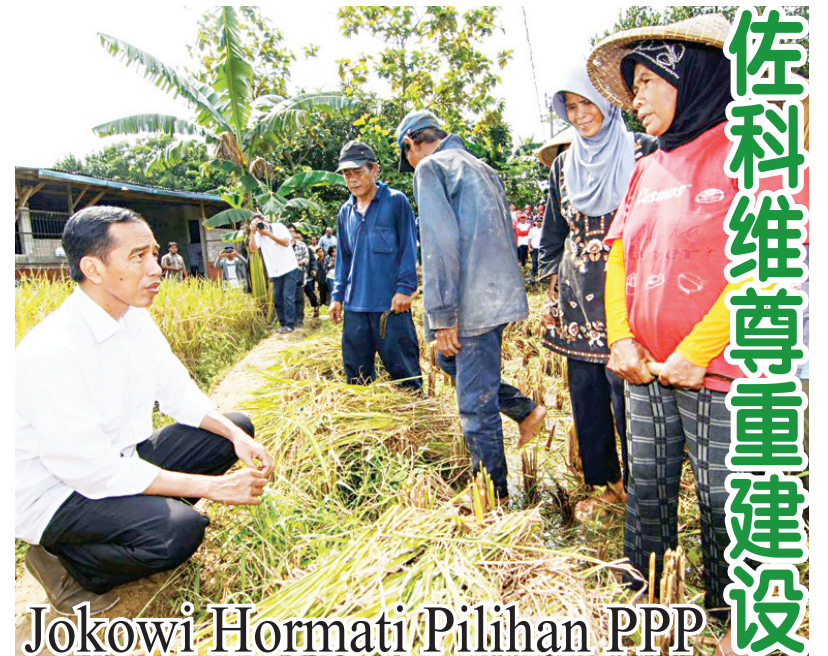
Jokowi Hormati Pilihan PPP Mendukung Prabowo