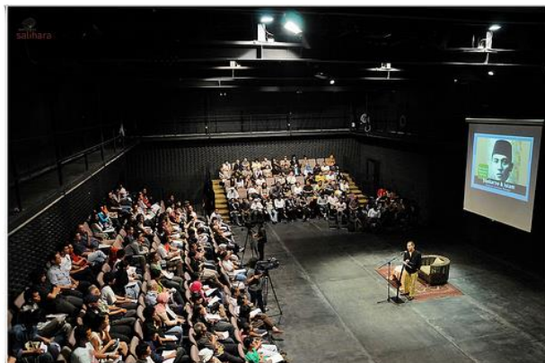
Gambar 4.5 Panggung