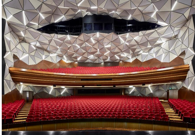
Gambar 4.1 Teater Ciputra Artpreneur