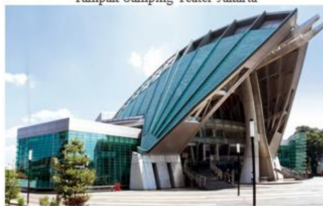
Gambar 4.7 Tampak samping Teater Jakarta

Teater Jakarta berlokasi di Pusat Kesenian Jakarta Taman Ismail Marzuki, tepatnya di Jalan Cikini Raya No.73 Jakarta Pusat. Merupakan teater besar yang mempertunjukan berbagai pertunjukan seni serta galeri seni. Teater Jakarta mampu menampung 1200 orang dengan total luas lantai adalah 40.108m 2 dari luas lahan 14.732m 2 dan dilengkapi dengan fasilitas fly tower dengan ketinggian sama dengan panggung, yang memungkinkan para kru panggung mengganti latar belakang pertunjukan secara vertikal.