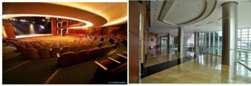
Gambar 4.8 Teater dan lobby