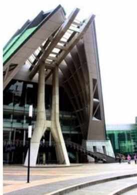
Gambar 4.6 Teater Jakarta