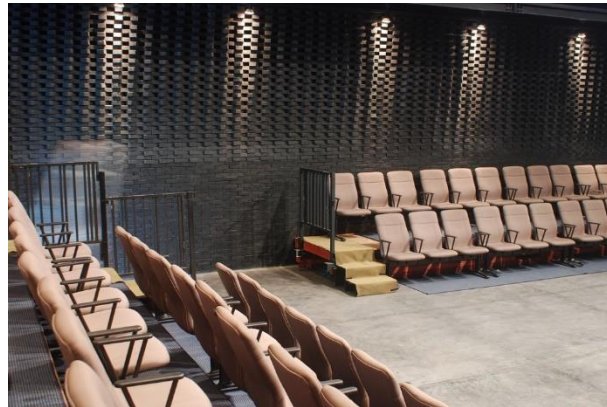
Gambar 4.4 Ruang teater Salihara

Yang menarik ketika masuk ke dalam teater adalah permainan batu bata yang terdapat pada dinding kanan dan kiri teater. Penyusunan ini bukanlah estetika semata, melainkan agar suara yang dihasilkan dari panggung teater tidak mengalami penggemaan ataupun penggaungan.