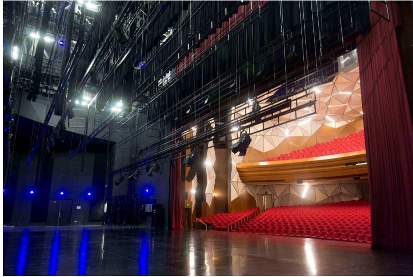
Gambar 4.2 Stage Ciputra Artpreneur Theater

Dinding dan plafon yang ada pada Ciputra Artpreneur Theater ini bergabung jadi satu, agar suara yang ada di panggung dapat terpantul kembali kepada audience.