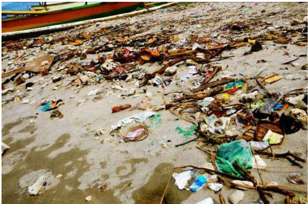
Gambar 3.24 Editing : Potret Dunia Ku