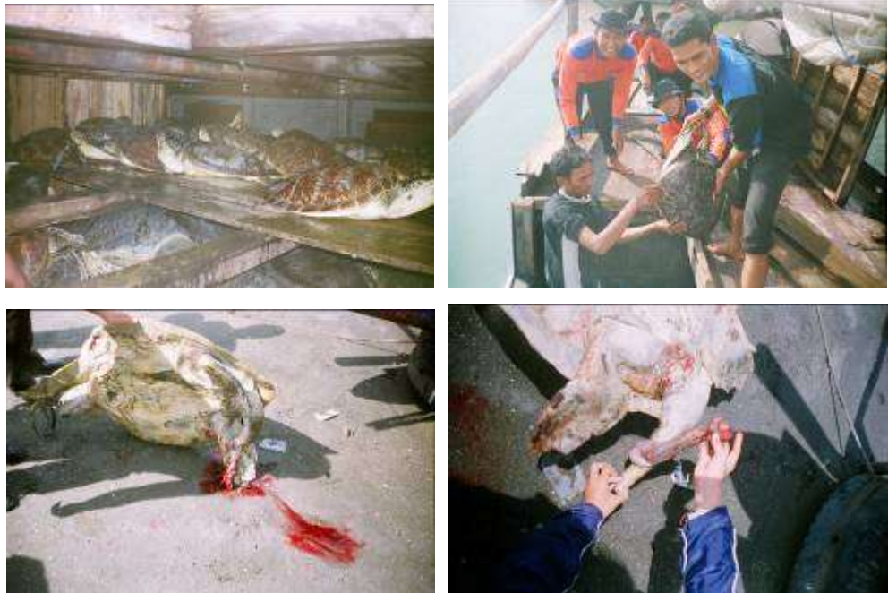
Foto repro sesudah