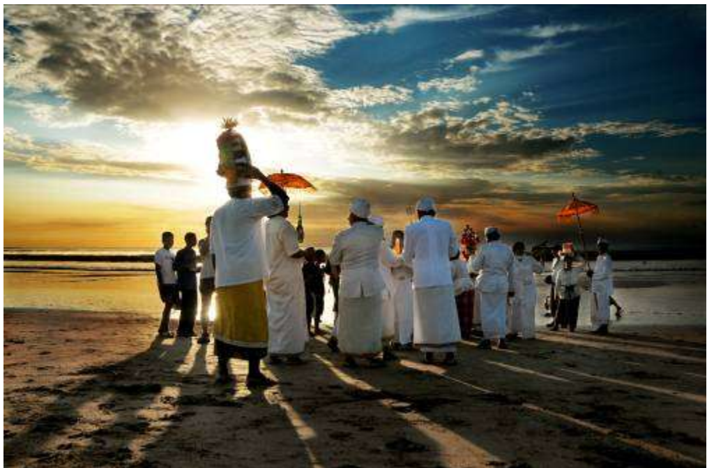
Gambar 3.23 Editing : Dalam Bayang-Bayang Senja