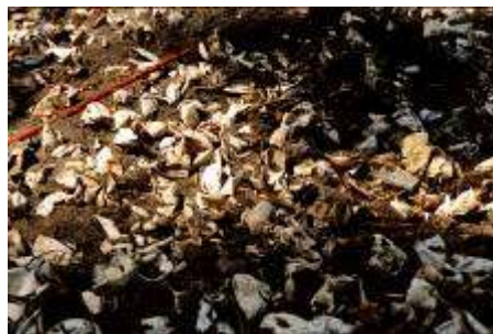
Gambar 3.6. Pemotretan Tahap III : Sisa Kulit Telur Penyu

Memotret tempat-tempat yang tidak mendukung pelestarian penyu di Bali. Pantai yang kotor karena polusi, sampah dan degradasi habitat. Tempat yang menjadikan penyu sebagai wisata untuk kepentingan sepihak tanpa mempedulikan ijin dan kebersihan tempat penyu itu dikurung. Juga tempat yang dibilang menjual daging penyu untuk dikonsumsi sebagai sate. Kemudian foto repro yang didapat dari data pusat pendidikan dan konservasi penyu Serangan, Bali.