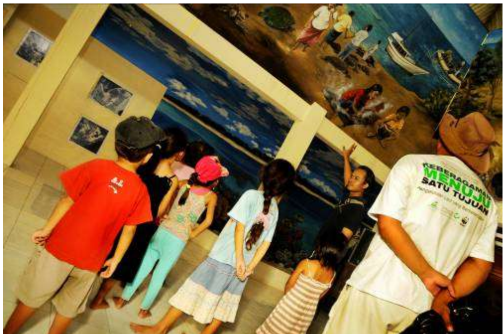
Gambar 3.11. Editing : Generasi Penerus