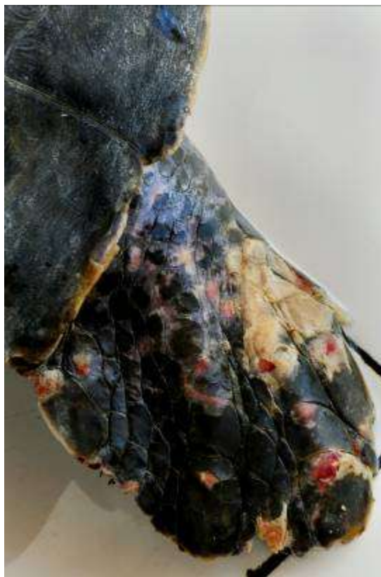
Gambar 3.16 Editing : Bercak Kebengisan