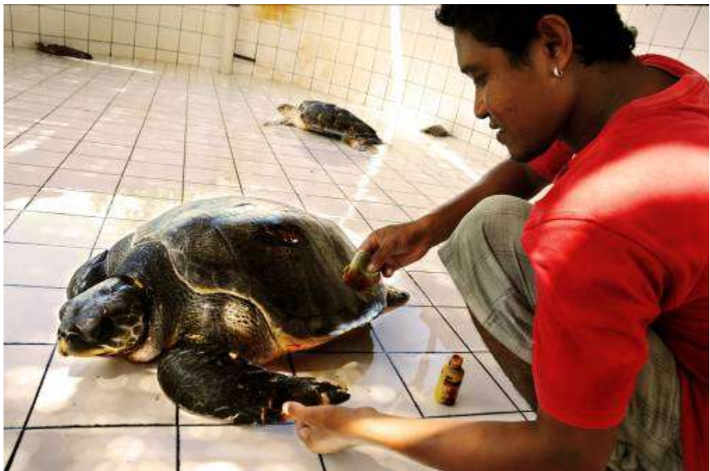
Gambar 3.13 Editing : Andai Semua Adalah Kawan Ku