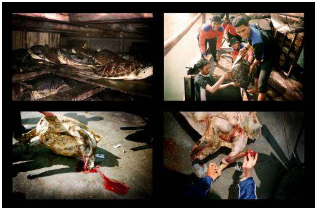
Gambar 3.34 Editing : Dok.TCEC ” Teman-Teman Ku Yang Menjadi Korban ”