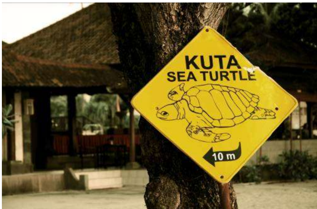
Gambar 3.32 Editing : Main Ke Rumah Ku Ya