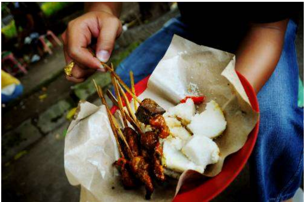
Gambar 3.31 Editing : Aku Hanya Diam Membisu