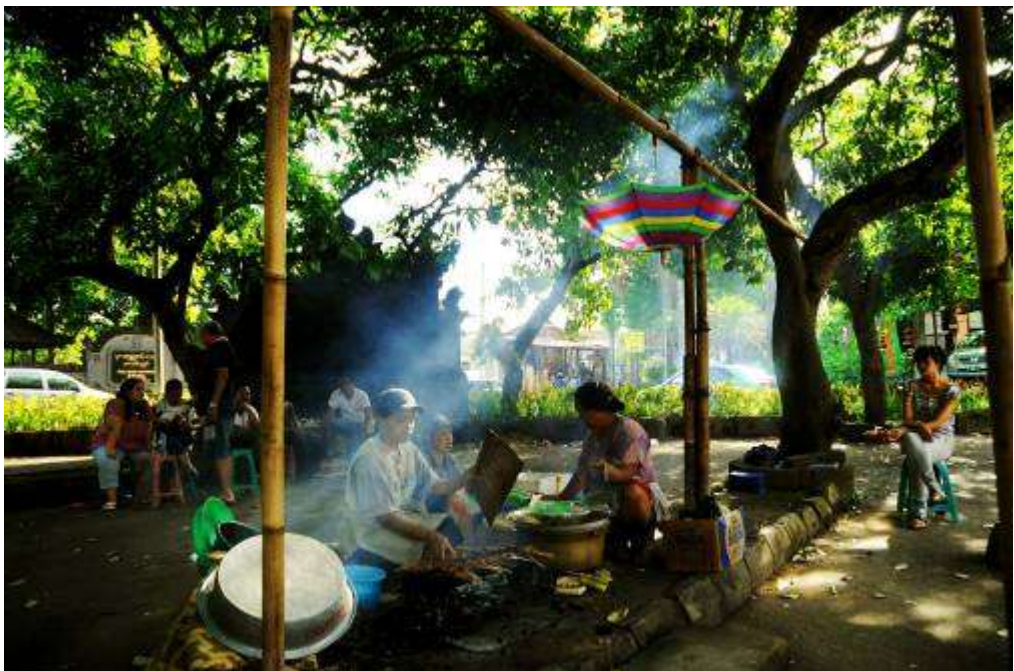
Gambar 3.30 Editing : Di Sini Aku Berakhir