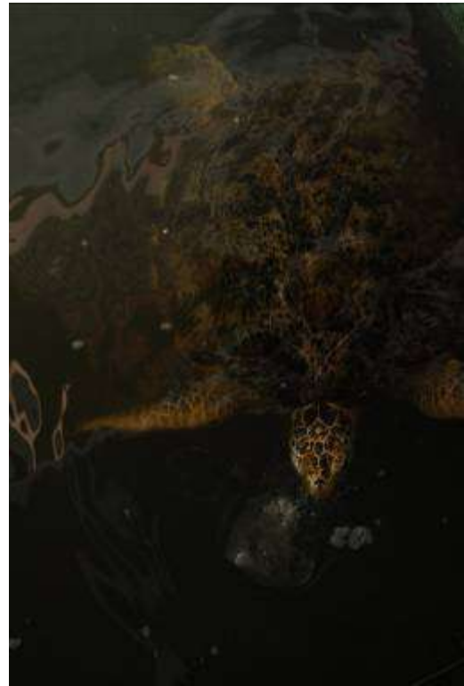
Gambar 3.8. Pemotretan Tahap III : Eksploitasi