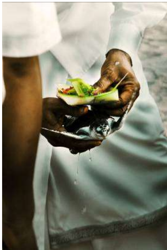
Gambar 3.18 Editing : Saat Prosesi Upacara