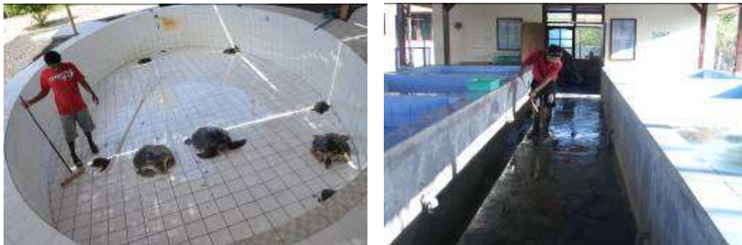
Gambar 3.1. Pemotretan Tahap I : Pembersihan Kolam

Memotret kegiatan sehari – hari yang dilakukan di pusat pendidikan dan konservasi penyu yang terletak di desa Pekraman, Serangan Bali. Mulai dari pagi hari pembersihan kolam, pemberian makan, dan pengobatan pada penyu yang sakit dan terluka. Kegiatan pendidikan kepada anak-anak yang dilakukan dengan tujuan supaya mereka tahu tentang penyu dan ikut melestarikannya.