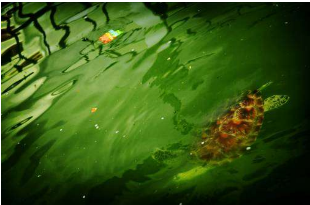
Gambar 3.28 Editing : Keruhnya Hidup Ku