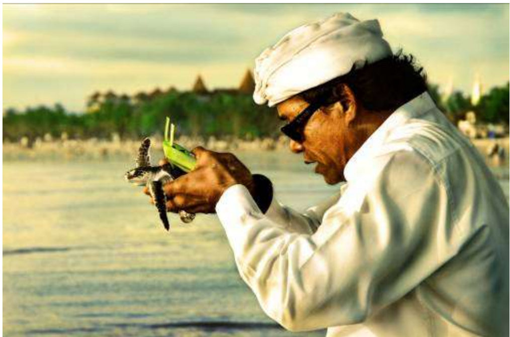
Gambar 3.21 Editing : Di Dalam Doa