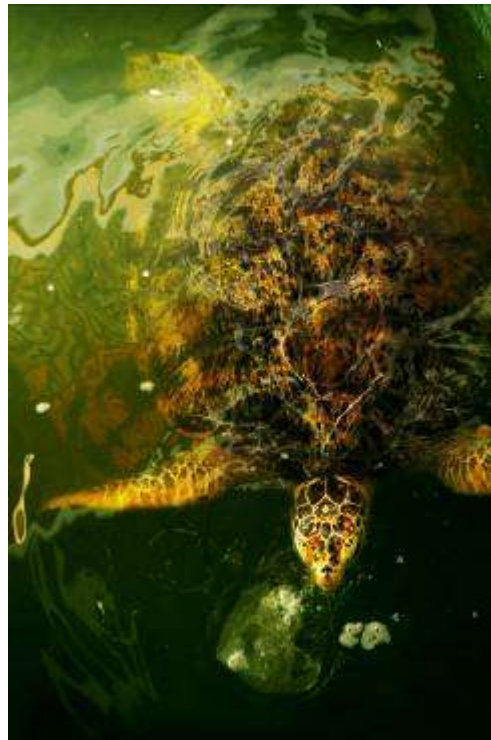
Gambar 3.29 Editing : Berhembus Dalam Kantong Plastik