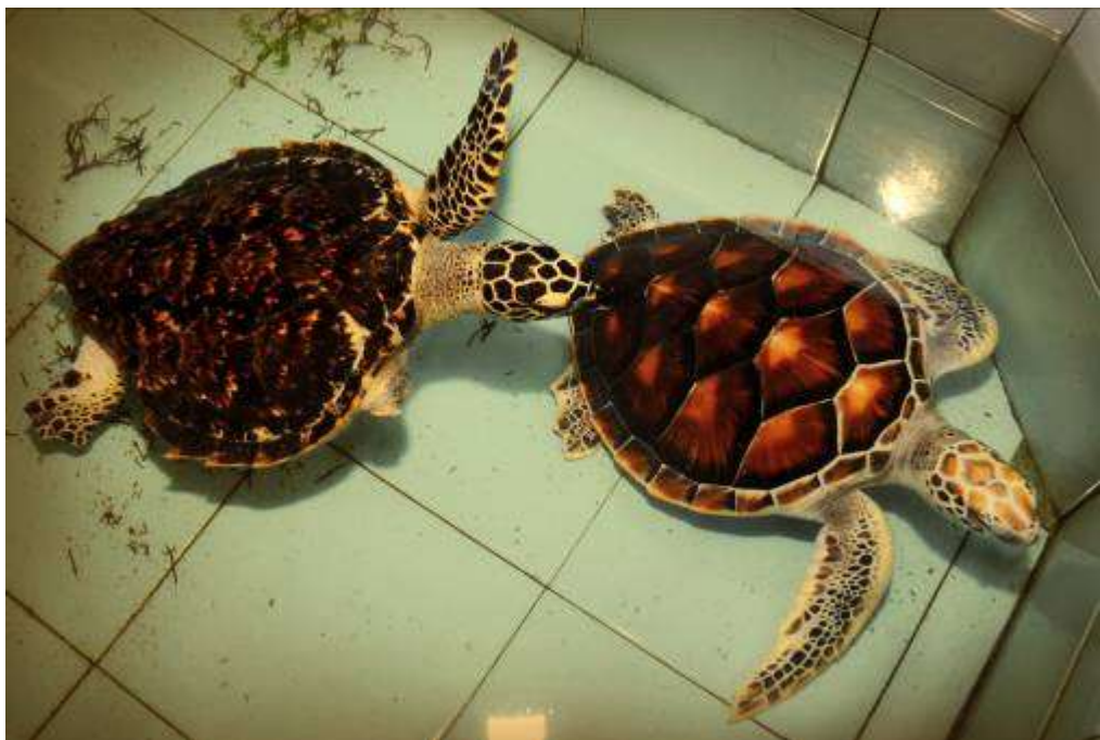
Gambar 3.17 Editing : Aku Mulai Menyesuaikan Diri