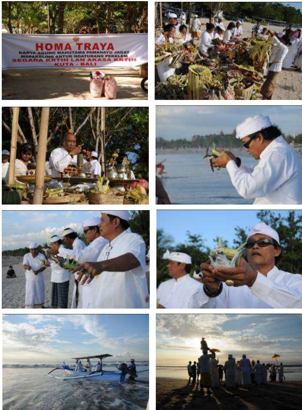
Gambar 3.5. Pemotretan Tahap II : Upacara

Memotret kegiatan upacara pelepasan penyu di pantai Kuta Bali, Dalam rangka Homa Traya “ Karya Agung Mahutama Pamahayu Jagat Mapakeling Antuk Ngaturang Pakelem “.