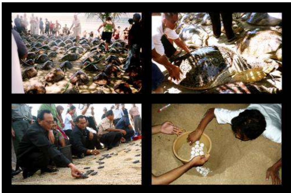
Gambar 3.33 Editing : Dok.TCEC ” Kisah Penyelamatan Ku ”