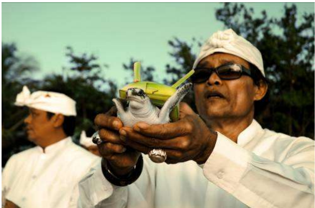
Gambar 3.20 Editing : Aku Dalam Genggamannya