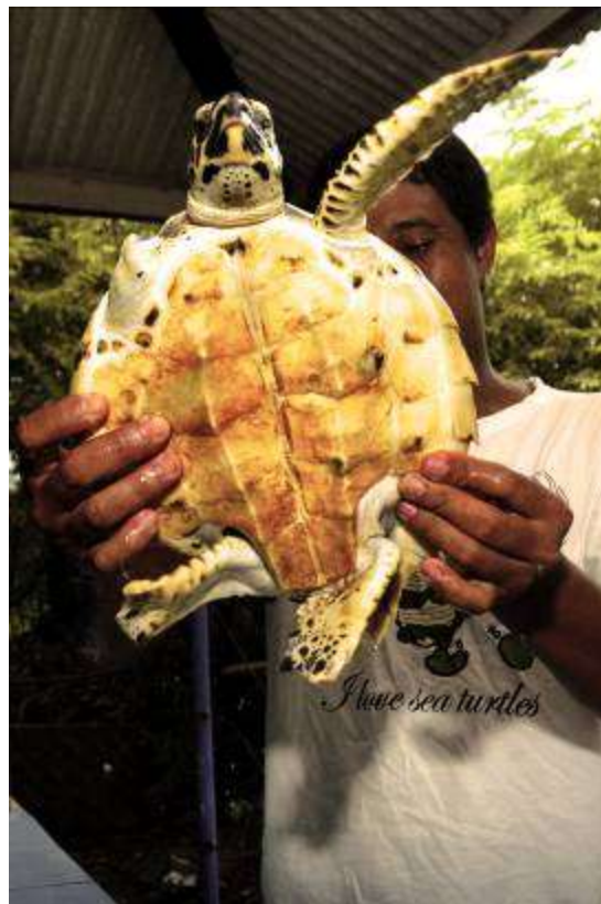
Gambar 3.12. Editing : Halo!!!