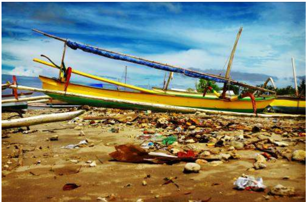
Gambar 3.25 Editing : Ketika Manusia Mendekat