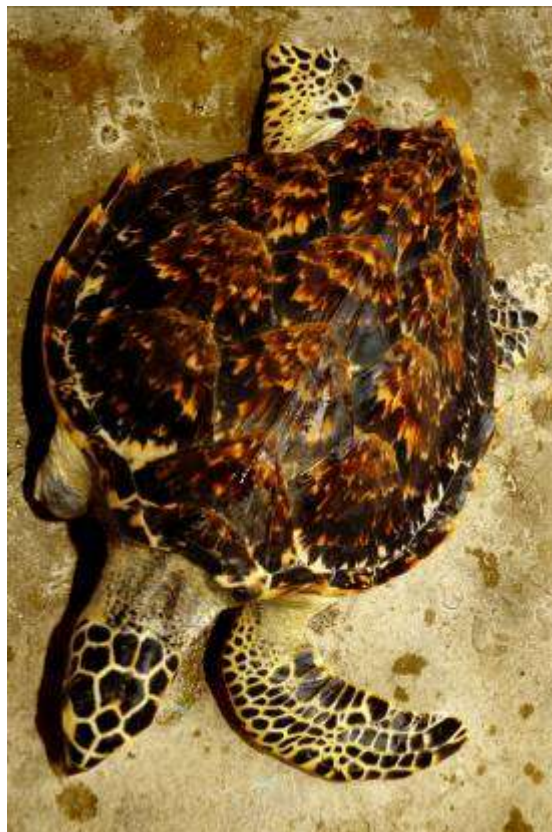
Gambar 3.15 Editing : Siapa Yang Membuat Ku Begini ?