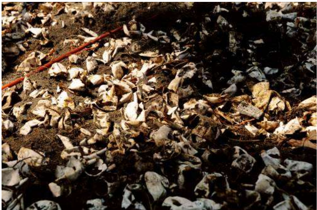
Gambar 3.26 Editing : Berkas Kehidupan