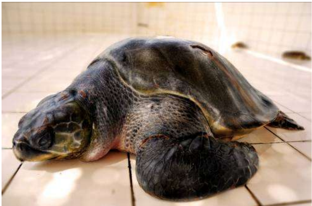
Gambar 3.14 Editing : Aku Luka Akibat Tangan Manusia