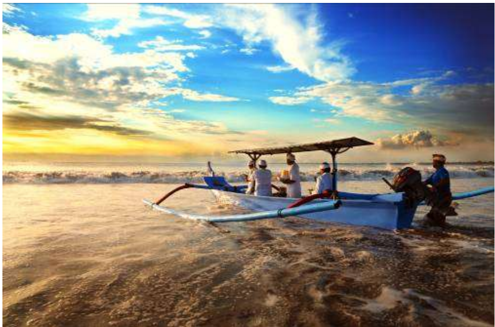
Gambar 3.22 Editing : Aku Kembali Bersama Keindahan Alam