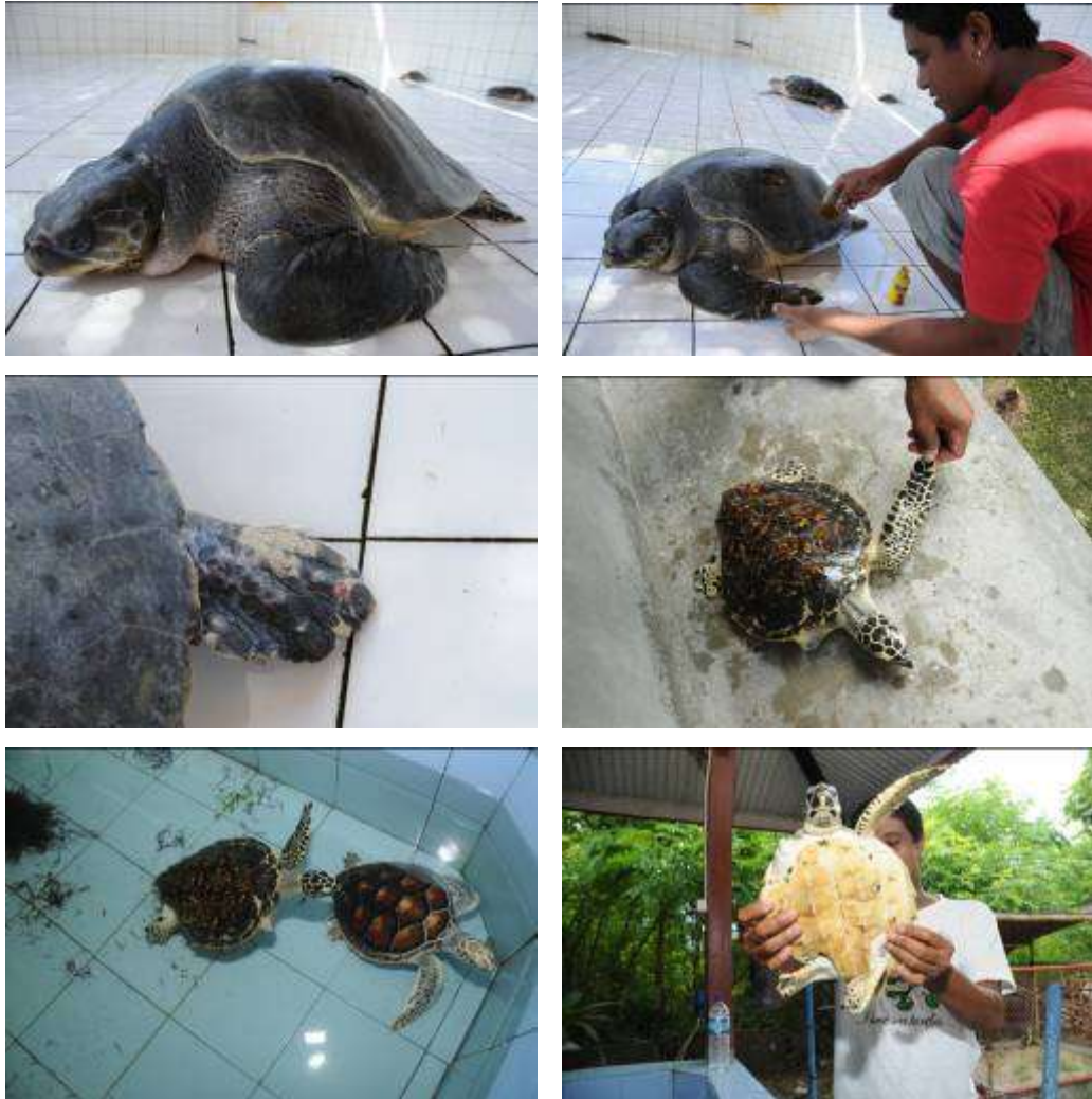
Gambar 3.3. Pemotretan Tahap I : Pengobatan