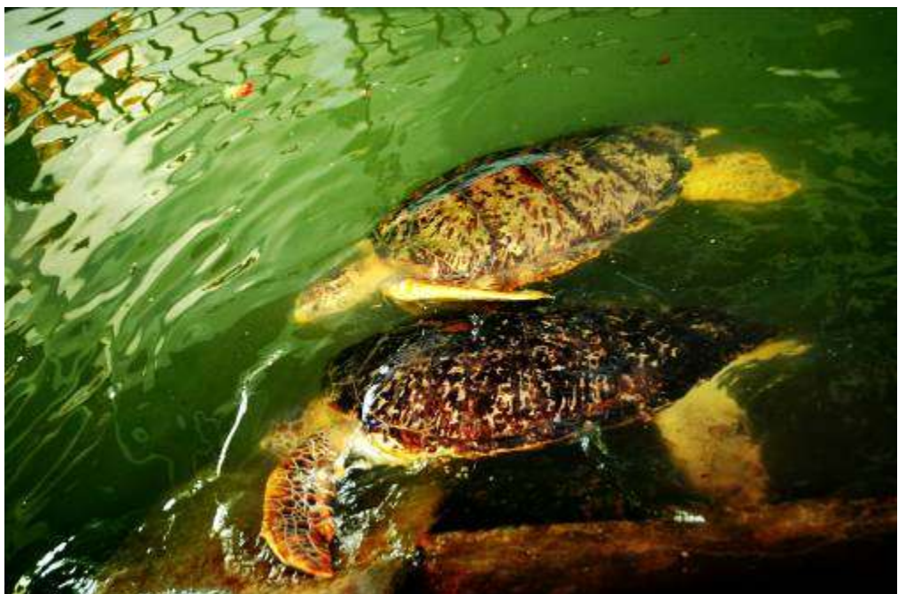
Gambar 3.27 Editing : Bermain dalam Kesia-siaan