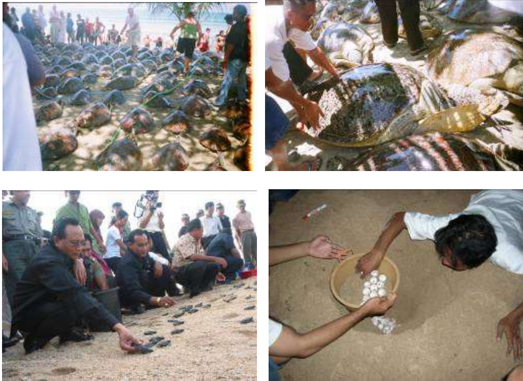
Gambar 3.9. Pemotretan Tahap III : Repro dok.TC