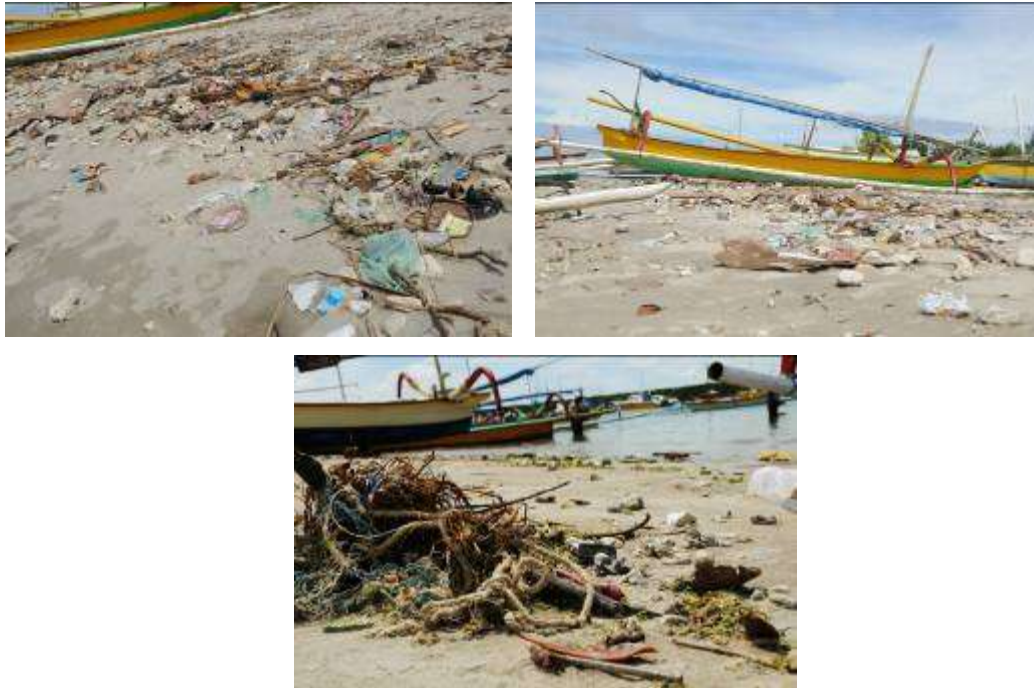
Gambar 3.7. Pemotretan Tahap III : Polusi dan Degradasi Habitat