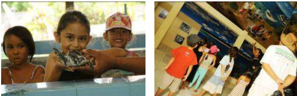
Gambar 3.4. Pemotretan Tahap I : Pendidikan