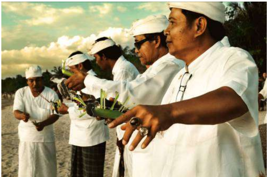
Gambar 3.19 Editing : Upacara Manusia Melepas Aku