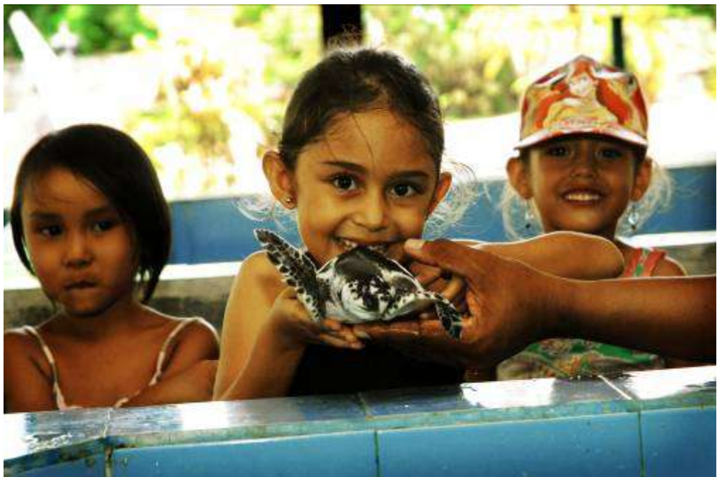
Gambar 3.10. Editing : Dia Sayang Aku