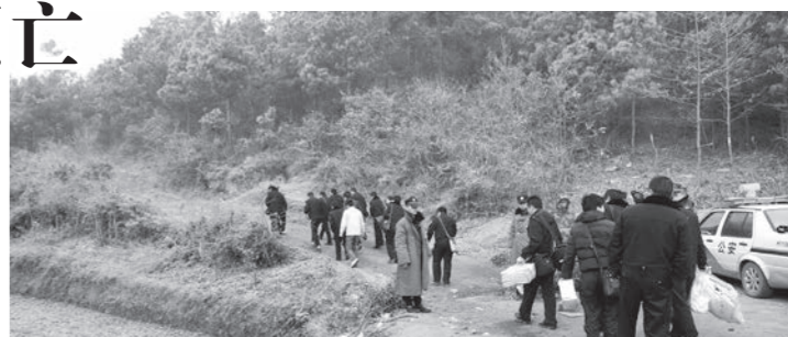
1月14日,民警进入贵州凯里“1·13”爆炸案件现场调查。

(新华社广州讯) 广州市白云区政府12日通报,12日凌晨该区一民宅发生火灾,造成6人死亡。