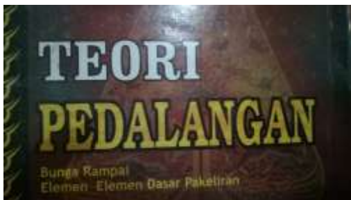
Gambar 2.14. Typeface Judul Buku Pembanding di Pasaran (1)