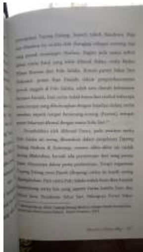
Gambar 2.12. Layout Buku Pembanding di Pasaran (1)