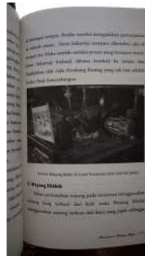
Gambar 2.13. Layout Buku Pembanding di Pasaran (2)