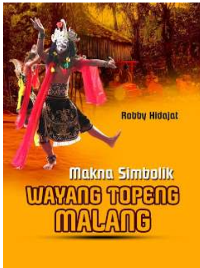
Gambar 2.8. Bentuk Cover Buku Pembanding di Pasaran dengan Tema Wayang Topeng Malangan (1)