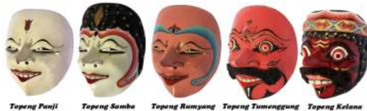
Gambar 2.1. Topeng Cirebon

mencerminkan seseorang yang sudah dewasa dan mapan. Terakhir, topeng Klana berwarna merah yang memiliki sifat kasar dan pemaarah, dimana mencerminkan sifat kerakusan manusia (Lasmiyati, 2011: 476; Prayitno, 2016).