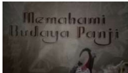
Gambar 2.15. Typeface Judul Buku Pembanding di Pasaran (2)