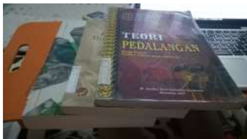
Gambar 2.16. Tebal Buku Pembanding di Pasaran (1)