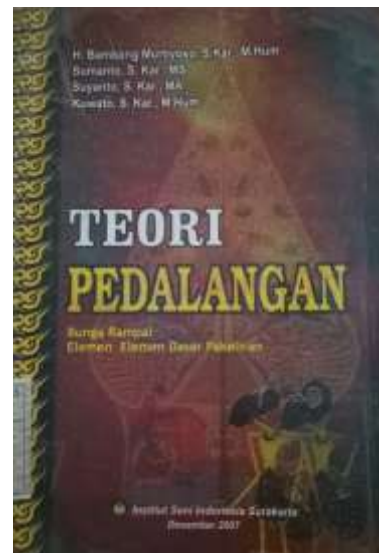
Gambar 2.11. Bentuk Cover Buku Pembanding di Pasaran dengan Tema Budaya (2)