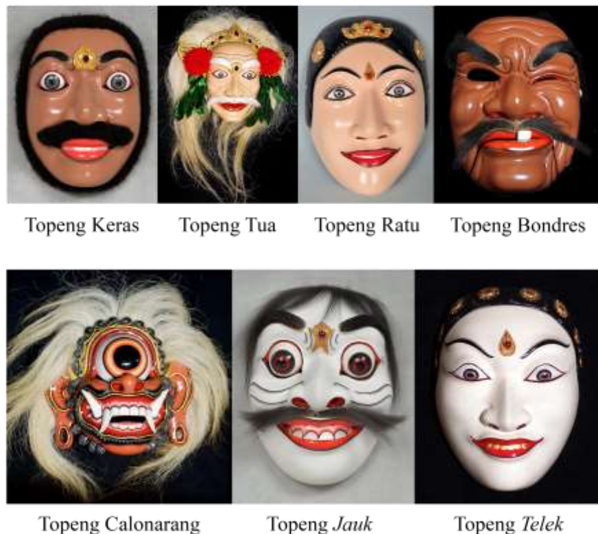
Gambar 2.4. Topeng Bali

Topeng merupakan perangkat utama dalam tari topeng Bali. Topeng Bali terbuat dari kayu kenaga dan pule . Terdapat beberapa topeng berdasarkan strata kelas sosial, yaitu topeng keras menggambarkan tokoh petarung, topeng tua menggambarkan tokoh sesepuh, topeng bondres menggambarkan rakyat biasa dan topeng ratu menggambarkan kalangan bangsawan. Selain itu terdapat topeng khusus juga, yaitu topeng Calonarang, topeng jauk dan topeng telek . Topeng Calonarang menggambarkan sosok buruk rupa, jahat, memiliki gigi bertaring dengan mata yang membelalak. Topeng Jauk menggambarkan watak kasar, peralihan manusia serta raksasa yang menjadi sekutu Barong. Topeng Telek merupakan sekutu Barong namun memiliki wajah dan sifat yang halus (Ardee, n.d.).