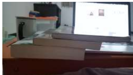
Gambar 2.17. Tebal Buku Pembanding di Pasaran (2) Sumber : Dokumentasi Pribadi