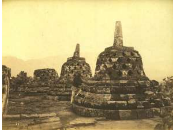
Gambar 2.7. Foto Candi Borobudur karya Kassian Cephas