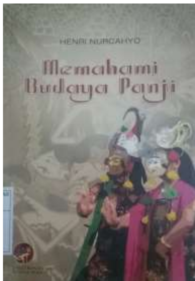
Gambar 2.10. Bentuk Cover Buku Pembanding di Pasaran dengan Tema Budaya (1)