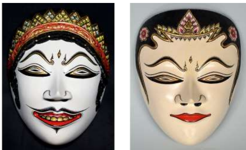
Gambar 2.3. Topeng Surakarta

Cerita dan bentuk topeng Surakarta menyerupai bentuk topeng Yogyakarta, yang membedakan hanya pada bentuk kumis lebih detail (Pramutono, 2014 ; Ki Soleh Adi Pramono, personal communication, April 7, 2018).