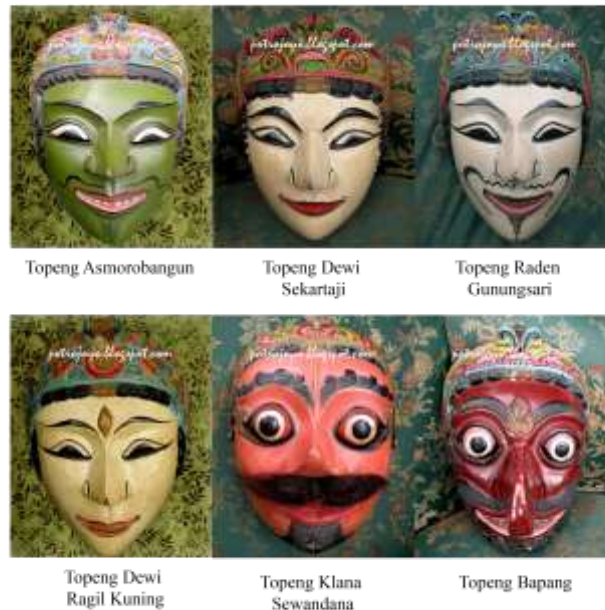
Gambar 2.6. Topeng Malangan