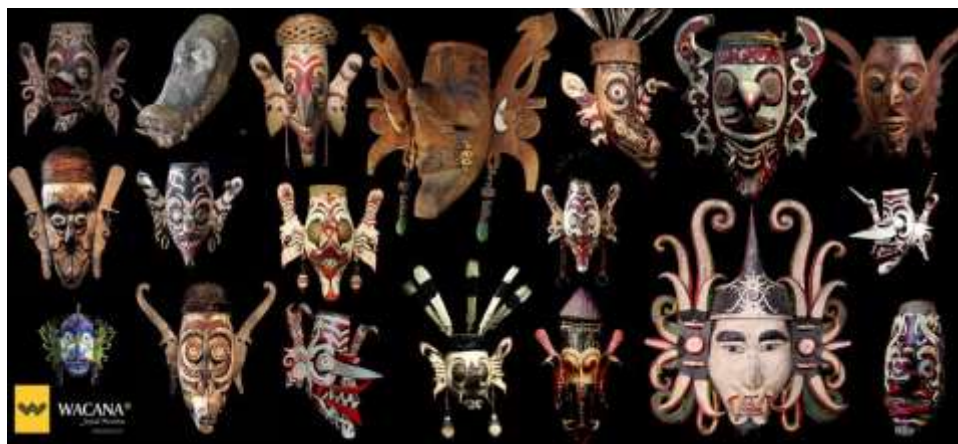
Gambar 2.5. Topeng Hudoq

Suku Dayak mengenal topeng dengan nama Hudoq yang merupakan topeng perwujudan. Hudoq dibuat untuk menakuti roh jahat yang membawa malapetaka. Hudoq berwujud binatang-binatang yang dianggap sebagai hama, seperti monyet dan babi serta binatang perusak lainnya. Selain itu Hudoq juga tampil dalam bentuk manusia sebagai perwujudan nenek moyang. Hudoq memiliki keunikan tersendiri dari bentuk, seperti bentuk mata besar, mulut dibuka lebar dan gigi mencolok. Warna yang digunakan pada umumnya warna putih untuk muka, hitam dan merah untuk lingkaran mata. Ada pula bentuk Hudoq yang khas dan cukup dikenal oleh masyarakat yaitu bentuk kepala burung dengan paruh yang mencuat panjang. Topeng ini digunakan pada tari Hudoq yang bertujuan untuk memohon berkah dan rahmat kepada Tuhan agar padi dapat membawa kemakmuran bagi masyarakat (Batara, 2017; “Kesenian Tari Hudoq Suku Dayak Bahau dan Modang”, 2016, Mei).