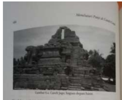
Gambar 2.18. Foto Hitam Putih sebagai Ilustrasi dalam Buku Pemandang