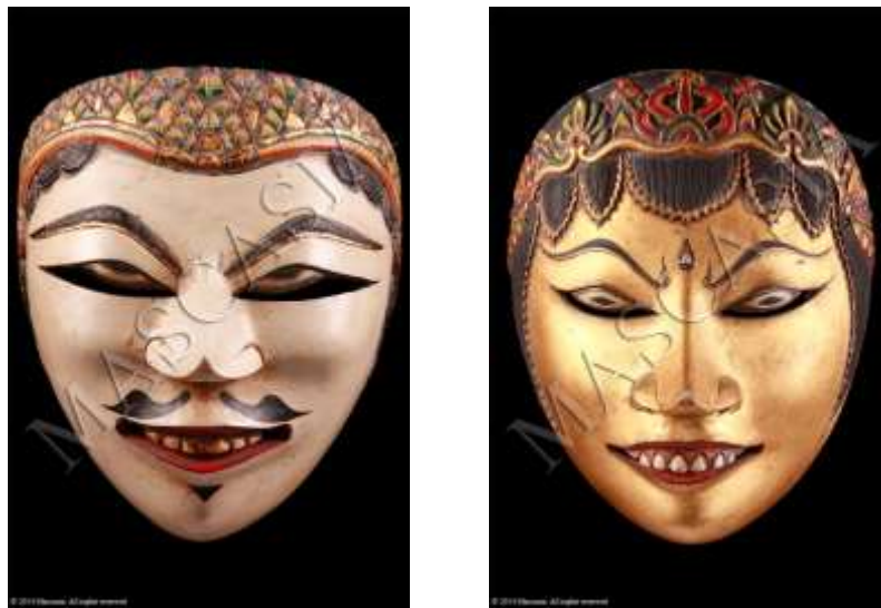
Gambar 2.2. Topeng Jogjakarta