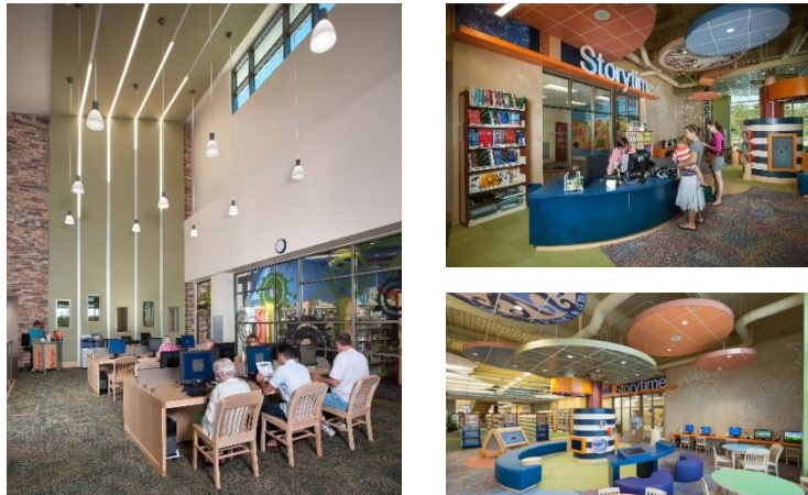
Gambar 4. 2. Perpustakaan Gulf Gate Library Sarasota