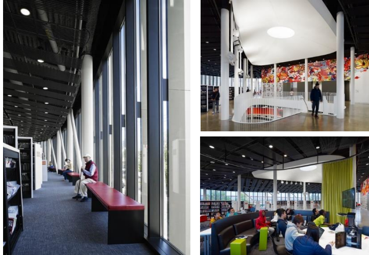
Gambar 4. 1. Perpustakaan Chicago Public Library Chinatown Branch